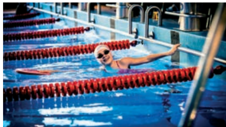
Fot. Remigiusz Naruszewicz